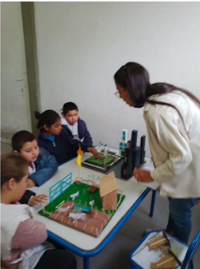
Figura 3. Actividad realizada en el campo de la Práctica.