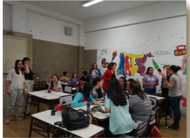
Figura 2. Encuentro entre estudiantes de 2° y 3° año de PEE.