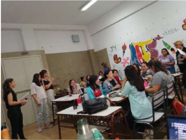
Figura 1. Encuentro entre estudiantes de 2° y 3° año de PEE.